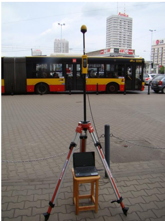
W03 Centrum Śródmieście Marszałkowska/Aleje Jerozolimskie N52°13'757 E21°00'660