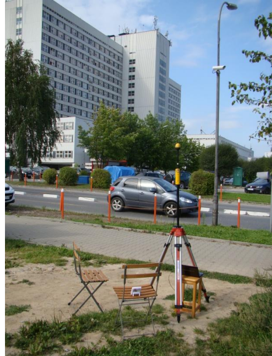
K06 Osiedle Mistrzejowice Szpital Wojewódzki N50°05'628 E20°01'273