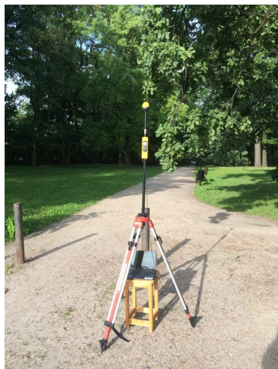
L04 Park im. Księcia Józefa Poniatowskiego Adama Mickiewicza – przy parku N51° 45'372 E19° 26.890