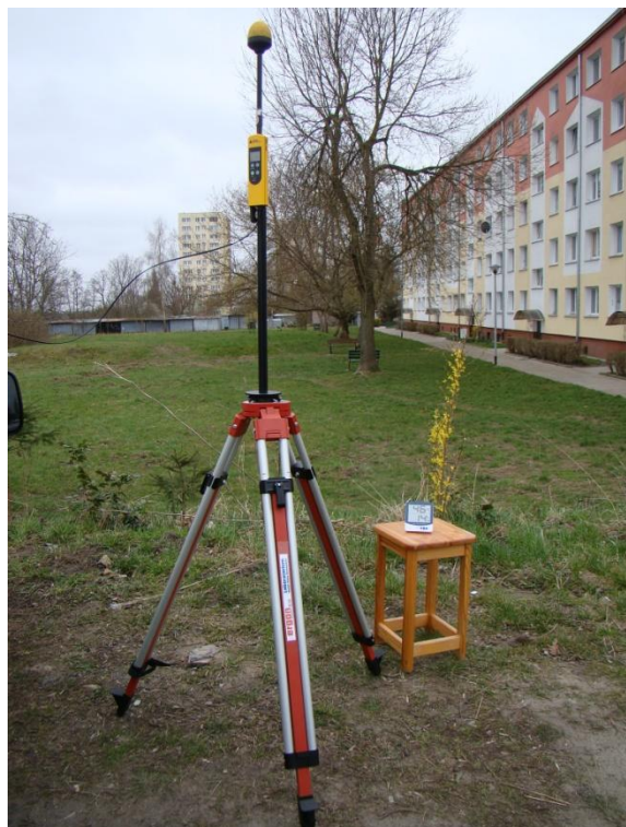
S08 Osiedle Pomorzany ul. Włociańska N53° 23'51.2" E14° 31'48.1"