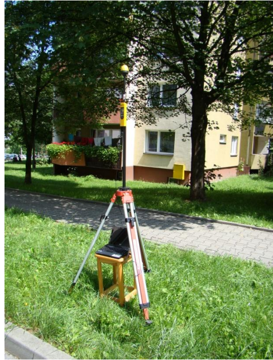
K10 Osiedle Piaski Ul. Włoska N50°01'067 E19°58'222