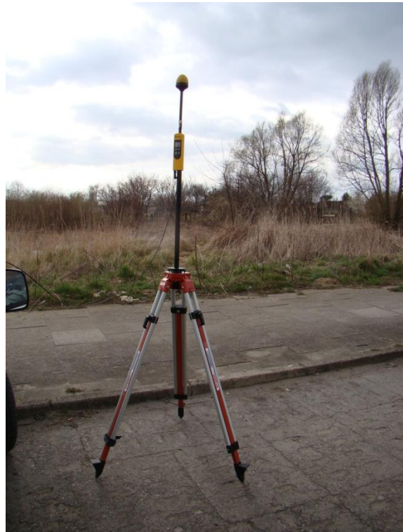
S02 Osiedle Samosierry ul. Kleeberga N53° 26'14.5" E14° 29'36.6"