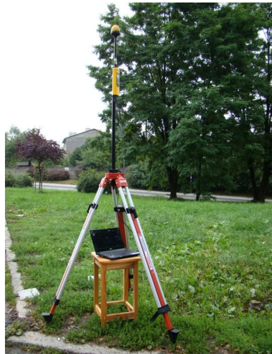
K08 Osiedle Bieżanów Ul. Mała Góra N50 °00'523 E20°01'269