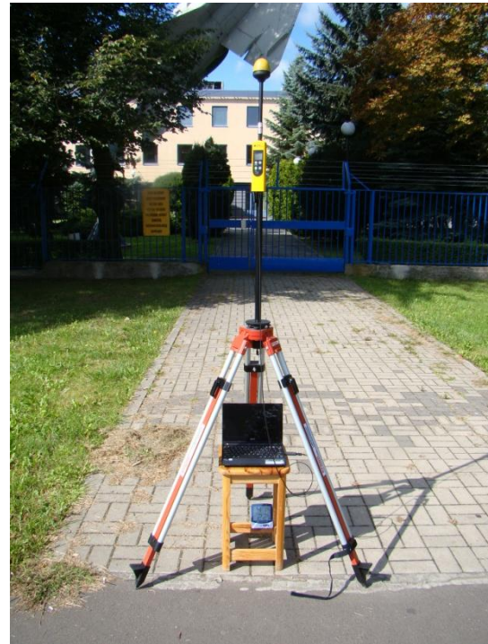
W16 Okęcie – Zbarż Okęcie / Żwirki i Wigury N52°10'613 E20°58'693