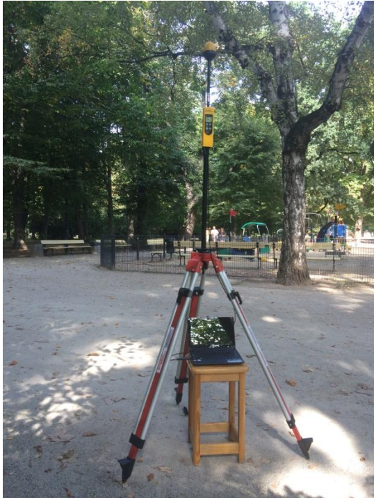
W01 Centrum Śródmieście Ogród Saski N52° 14'363 E21°00'606