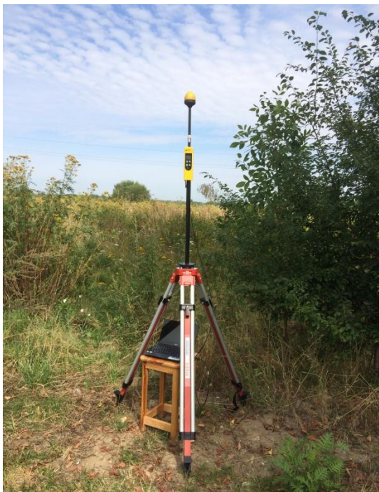
L05 Osiedle Retkinia Północ Janusza Kusocińskiego – Armii Krajowej N51° 45'029 E19° 23'444