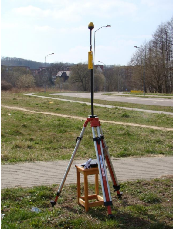
S09 Osiedle Nad Rudzianką ul. Swojska N53° 21'56.9" E14° 39'52.8"