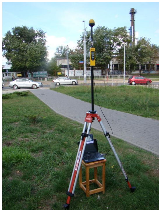
W08 Wola –Młynów Obozowa / Wawrzyszewska N52° 14'746 E20° 57'719