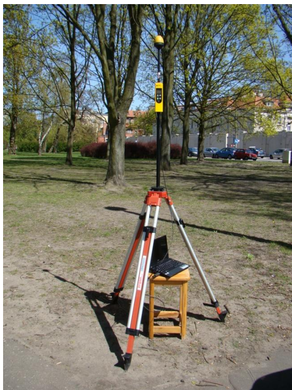
P07 Łazarz - Park im. Jana Kasprwicza ul. Jarochowskiego N52° 23'42.7" E16° 53'34.1"