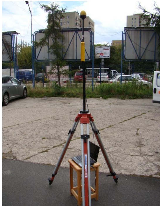
W06 Mokotów - Siekierki Czerniakowska / Bartycka N52° 12'732 E21° 02'874