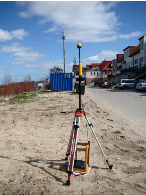
G02 Śródmieście - Osiedle Chełm ul. Biegańskiego N54° 20'41.7" E 18° 37'22.2"