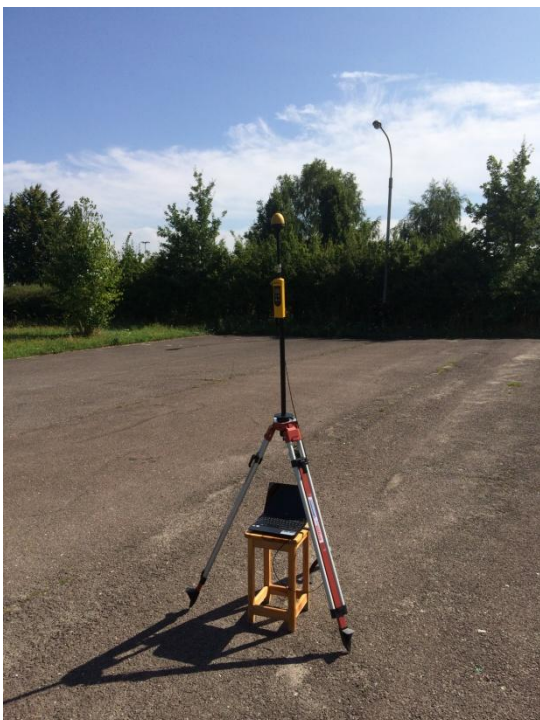
L03 Rejon szpitala Centrum Zdrowia Matki Polki Rzgowskiej – Paradnej N51°42'532 E19°29'128