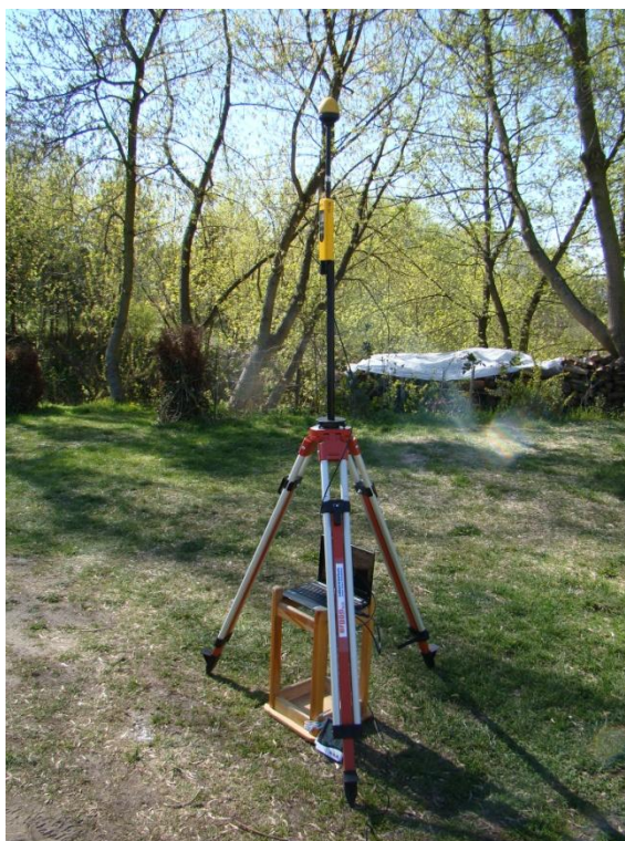
P08 Osiedle Świerzewo ul. Bohaterów Westerplatte N52° 22'15.4"E16° 52'43.5"