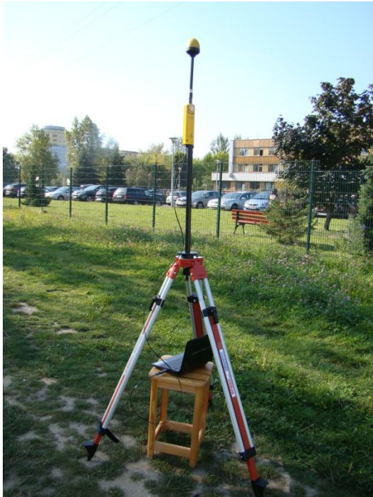
W15 Ursynów – Imielin Stary Ursynów (parking przy Szpitalu Onkologicznym) N52°08'877 E21 02'068