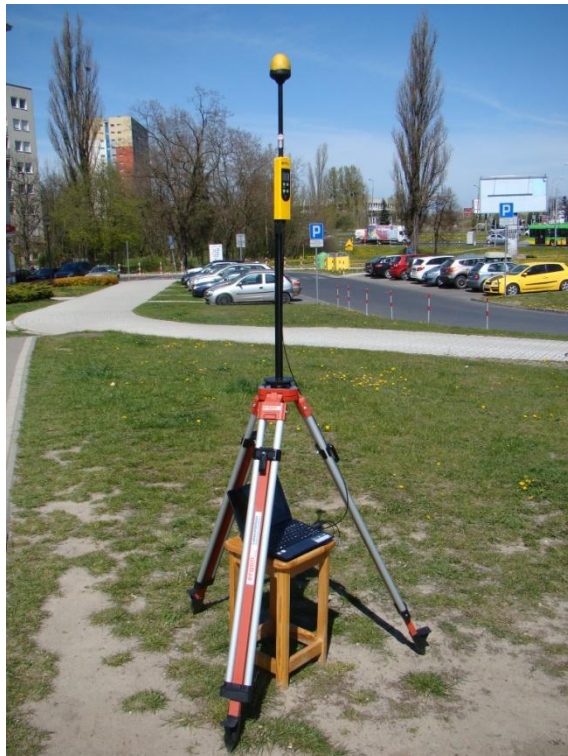
P05 Winogrody - Osiedle Pod Lipami ul. Karbowska N52° 25'52.9" E16° 56'43.6"