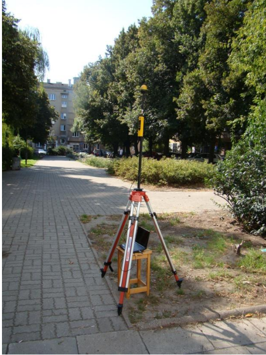
W13 Stary Mokotów Puławska / Odolańska N52°12'206 E21°01'333