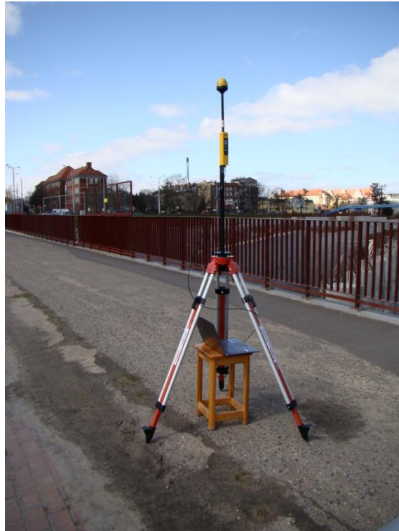
G01 Główne Miasto (Centrum) ul. Armii Krajowej N 54° 20'53.0" E 18° 38'37.5"