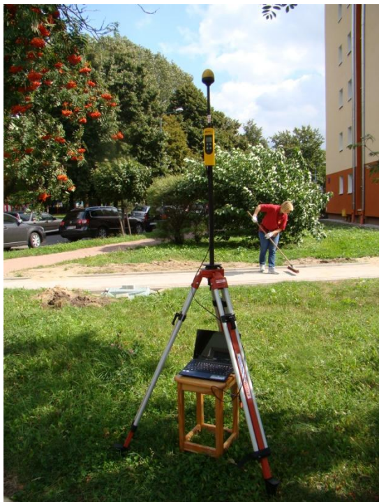
W09 Ochota – Rakowiec Dickensa / Pawińskiego N52°12'246 E20°58'540