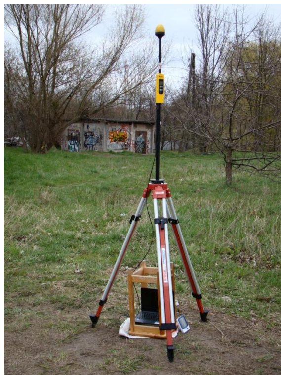
G03 Osiedle Morena - Piecki ul. Wileńska N54° 21'42.7" E 18° 35'31.5"