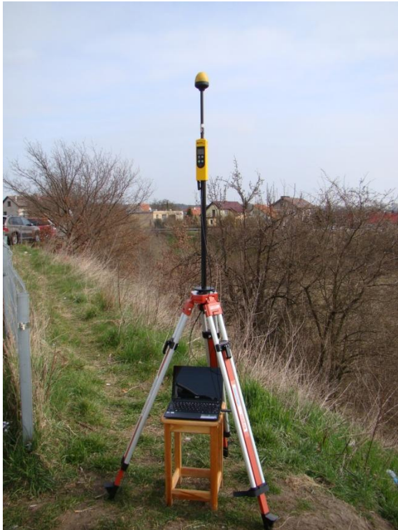
S01 Osiedle Pogodno rejon Szpitala Klinicznego N53° 26'56.5" E14° 30'23.5"