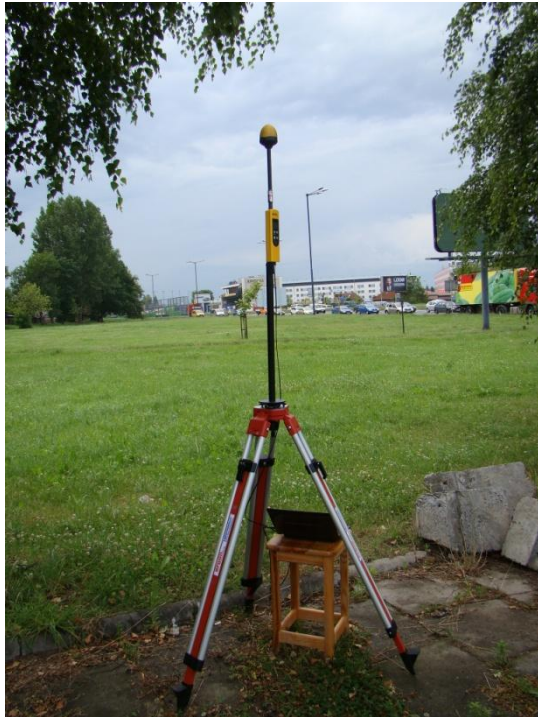
K05 Osiedle Azory Ul. Władysława Łokietka N50° 05'402 E19 °55'148