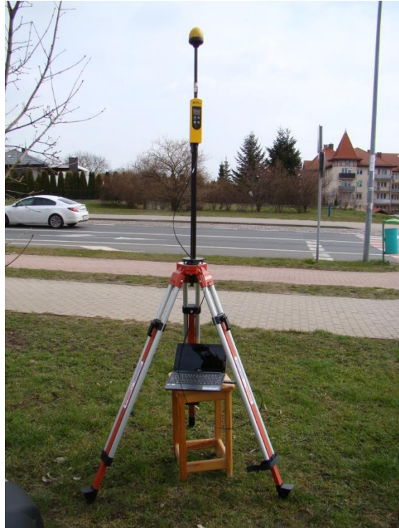
S06 Osiedle Warszewo ul. Duńska N53° 27'49.3" E14° 32'31.9"