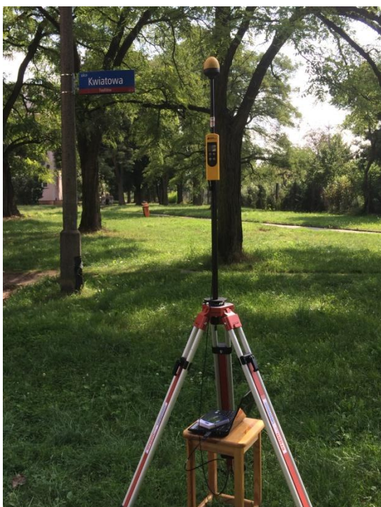
L07 Osiedle im. Władysława Reymonta Kwiatowej Klaretyńskiej N51° 47'409 E19° 23'901