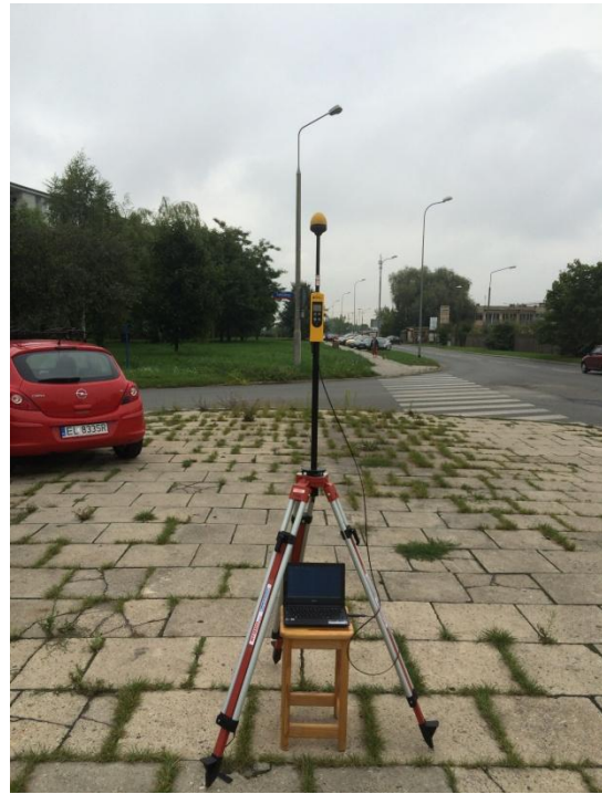
L02 Osiedle Tysiąclecia Państwa Polskiego Poli Gojawczyńskiej – Felińskiego N51°43'965 E19°30'364