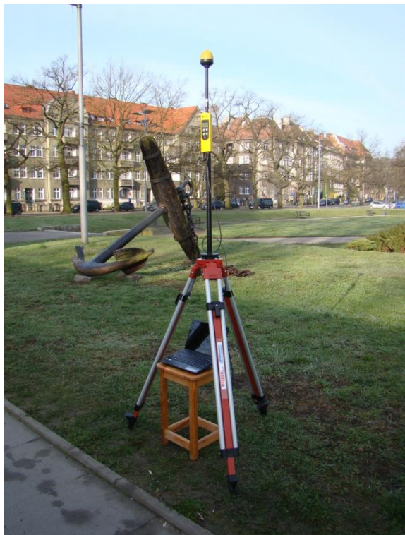
S04 Osiedle Śródmieście rejon Parku Kasprowicza N53° 26'28.4" E14° 32'21.3"