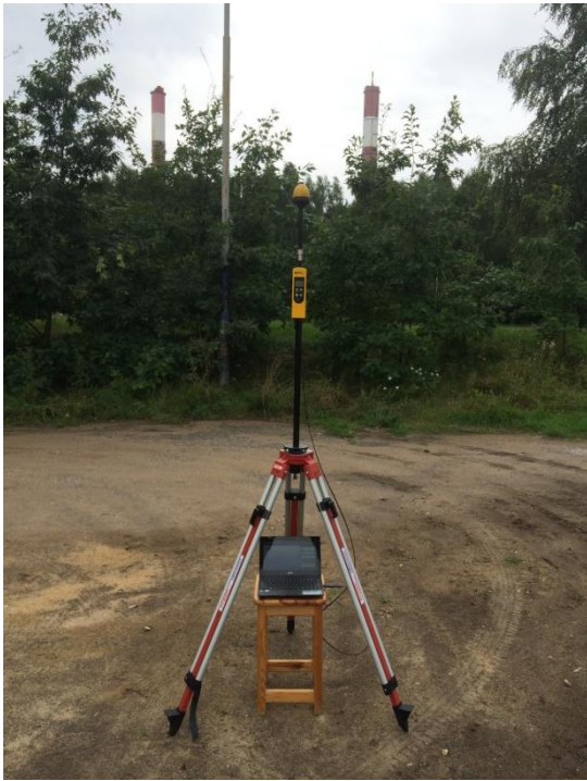
L01 Osiedle Bolesława Chrobrego Stanisława Przybyszewskiego – Czajkowskiego N51° 45'068 E19°32'615