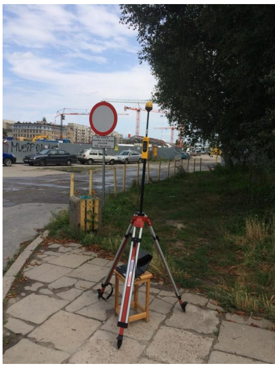
L08 Park im. Moniuszki (rejon stacji PKP-Łódź Fabryczna) Kilińskiego – Składowej N51° 46'115 E19° 27'902