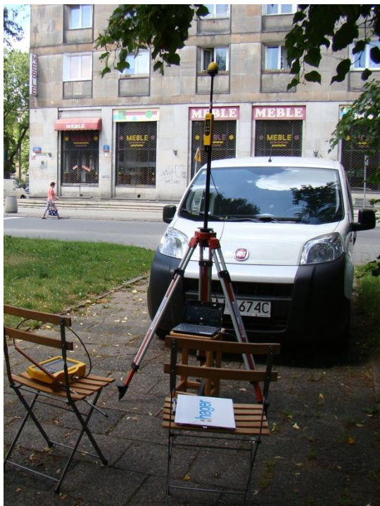
W07 Praga Północ – Nowa Praga Plac gen. Hallera N52° 15'620 E21° 01'659