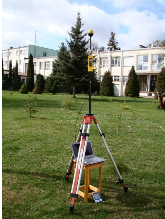
G09 Orunia - Osiedle Lipce ul. Trakt Św. Wojciecha N54° 18'22.5" E18° 37'54.6"