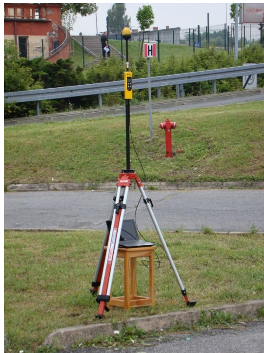
K11 Osiedle Borek Fałęcki Ul. Zakopiańska N50°00'822 E19°55'752