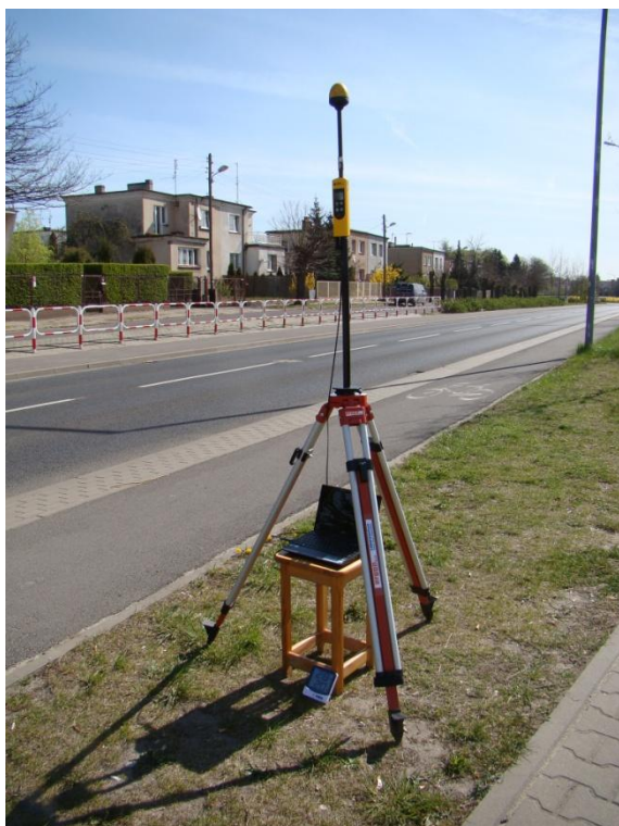
P09 Osiedle Antoninek ul. Mścibora N52° 24'27.2" E17° 01'04.9"