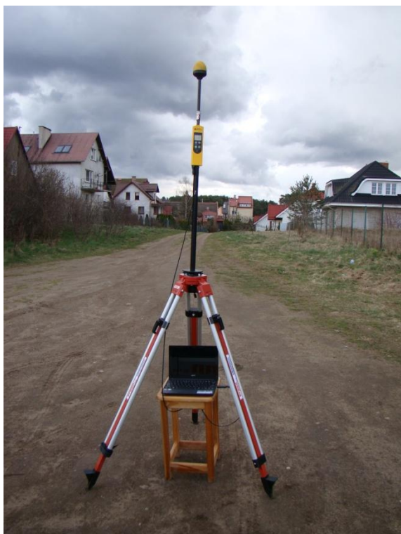
G04 Osiedle Osowa ul. Barniewicka N54° 25'53.6" E18° 27'41.3"