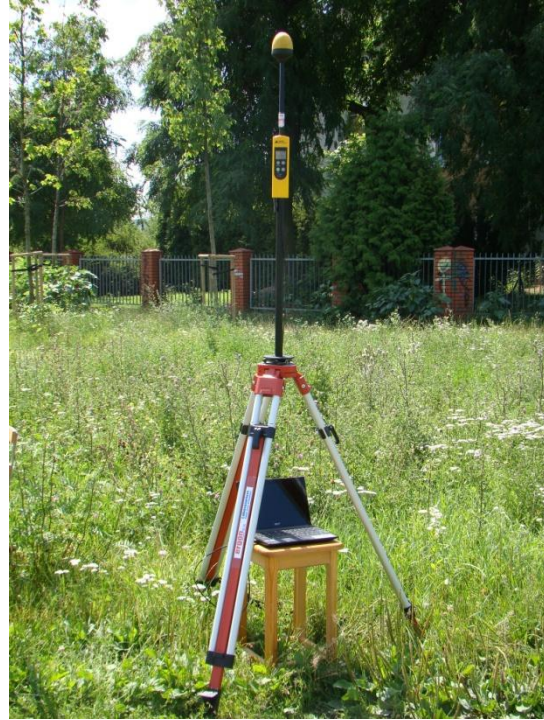
W14 Praga Południe – Goćław Goćławek (rejon ul. Międzyborskiej) N52°13'879 E21°05'329