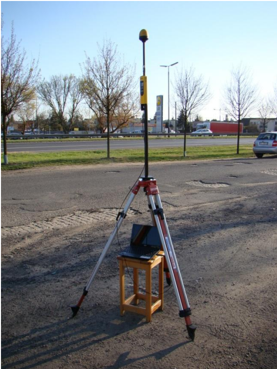
P04 Jeżyce - Osiedle Smochowice ul. Dąbrowskiego N52° 25'55.7" E16° 49'30.7"