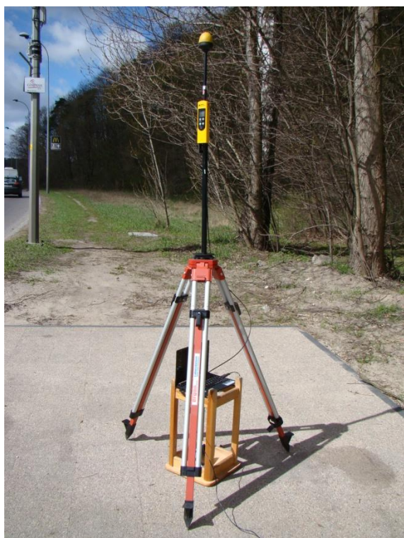
G06 Zaspa - Osiedle Biały Dwór ul. Czarny Dwór N54° 24'26.8" E18° 37'02.8"