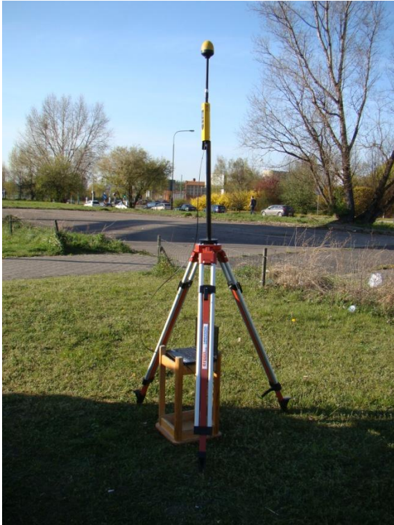
P02 Rataje - Osiedle Orta Białego ul. Kurlandzka N52° 22'37.7" E16° 57'28.3"