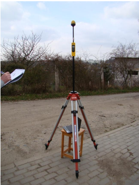
S03 Osiedle Gołębino ul. Strażkowska N53° 27'58.5" E14° 35'23.7"