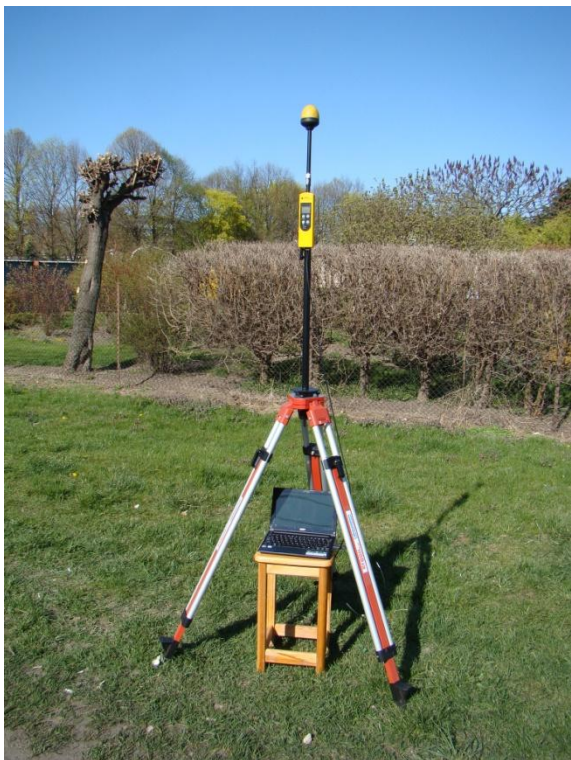
P06 Grunwald - Osiedle Kopernika ul. Jawornicka N52° 23'18.5" E16° 51'21.8"