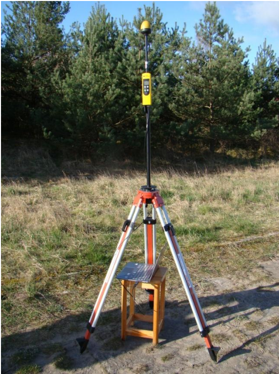
G00 Sobieszewo Wyspa Sobieszewska w delcie Wisły N54° 20'20.9" E 18° 53'28.3"