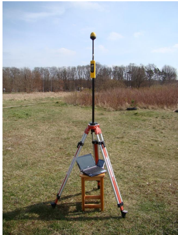
S10 Osiedle Dąbie ul. Babiego Lata N53° 24'13.3" E14° 41'15.9"