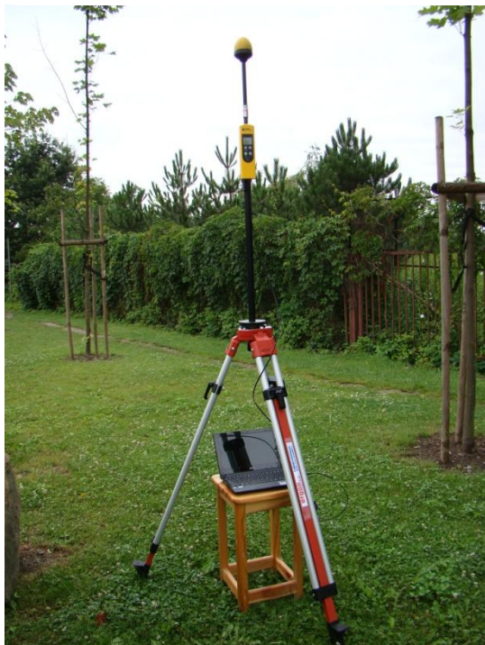
K03 Miasteczko studenckie Ul. Reymonta N 50°04'088 E 19°54'026