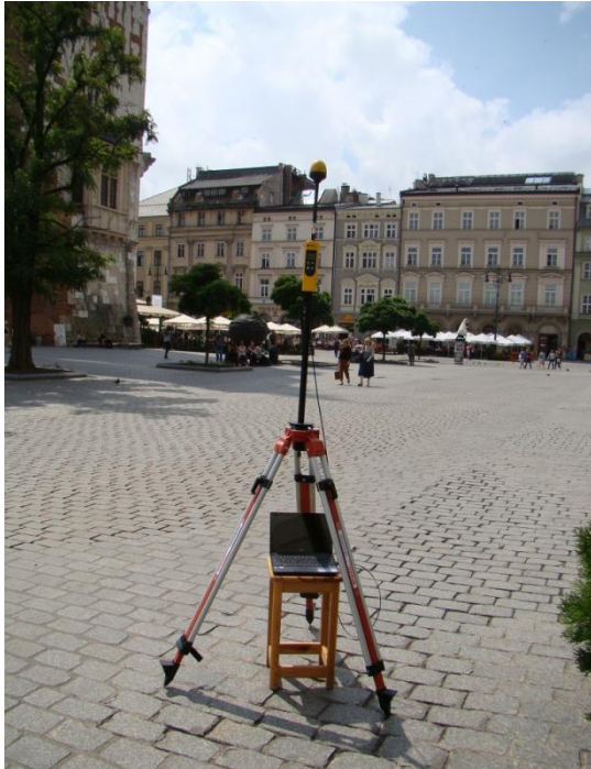
K01 Rynek Główny N 50°03'713 E 19°56'172