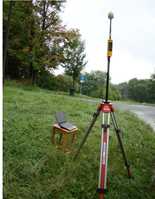
K02 Kopiec Kościuszki Ul. Malczewskiego N 50° 03'170 E 19° 53'528