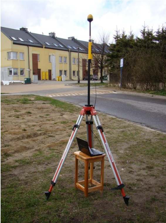
G08 Osiedle Kokoszki ul. Kminkowa N54° 21'09.9" E18° 30'49.3"