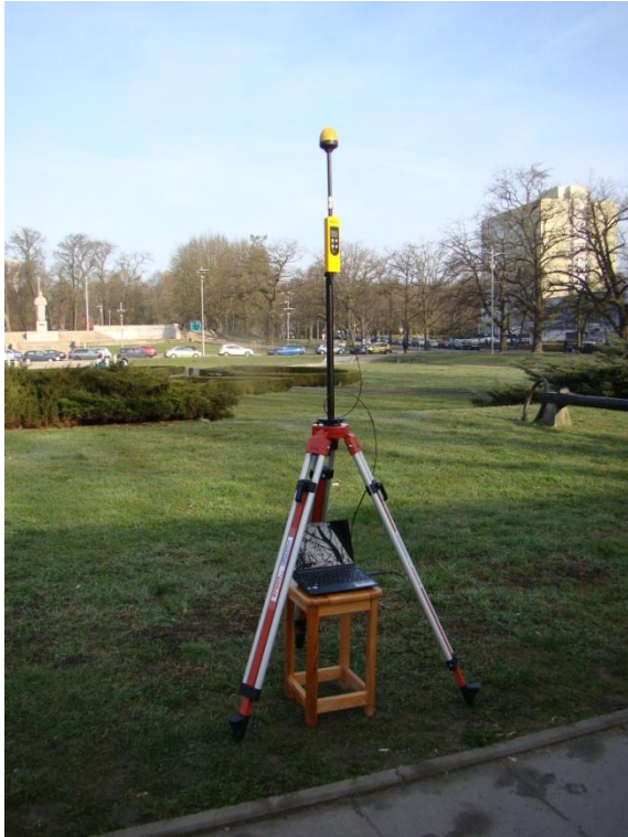
S05 Osiedle Śródmieście ul. Jarowita N53° 25'49.6" E14° 33'49.4"