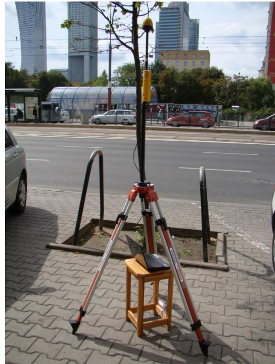
W02 Centrum Śródmieście Marszałkowska /Świętokrzyska N52° 14'899 E21° 00'303