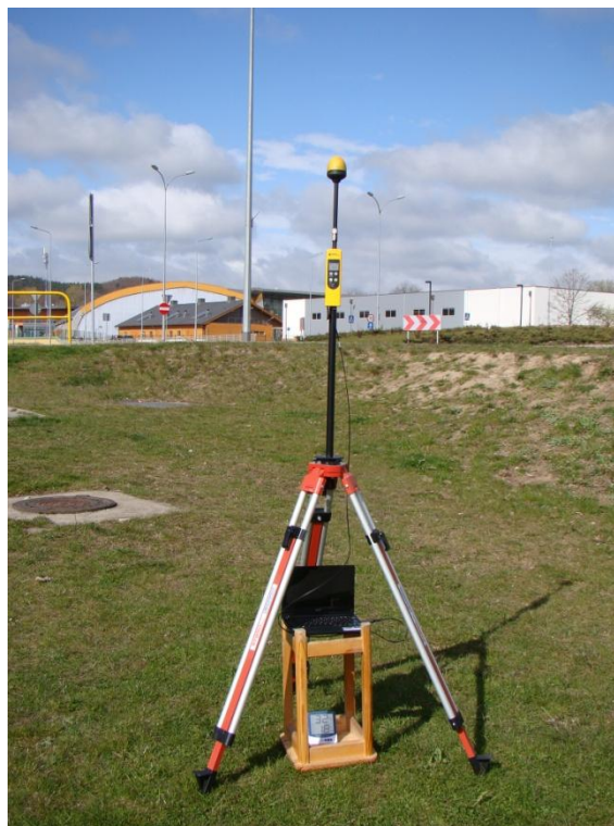
G05 Przymorze - Osiedle Żabianka ul. Rybacka N54° 25'29.4" E18° 34'38.2"