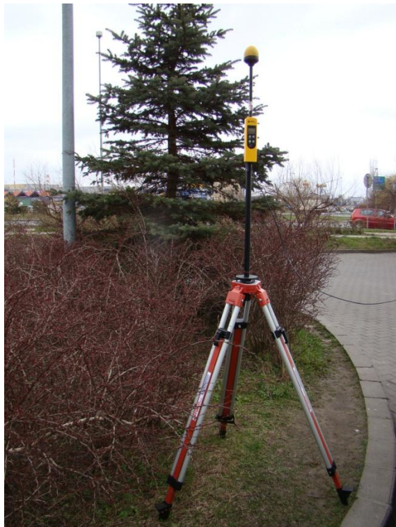
S07 Osiedle Reda ul. Cukrowa N53° 24'13.6" E14° 30'01.7"