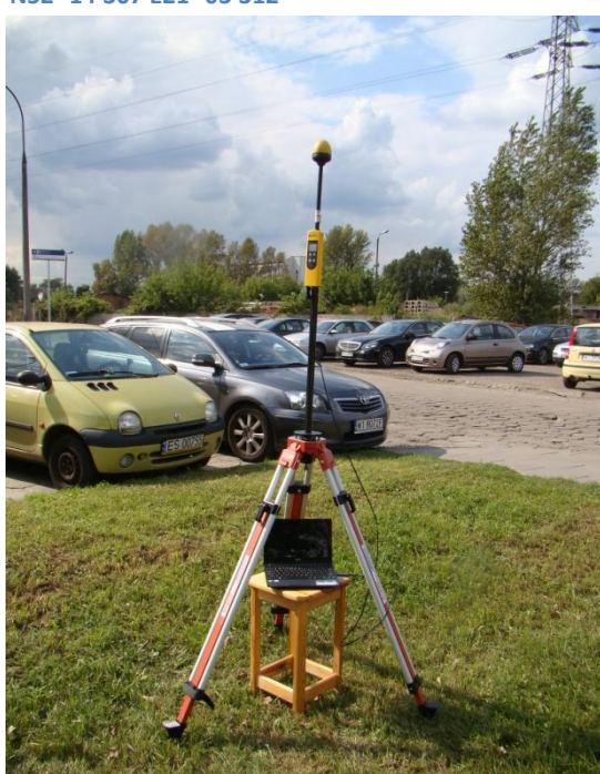
W12 Wola - Czyste Tunelowa / dworzec PKP Wa-wa Zachodnia N52 °13'257 E 20 °57'808