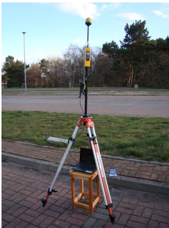
G07 Oliwa ul. Spacerowa N54° 24'37.6" E18° 33'12.8"