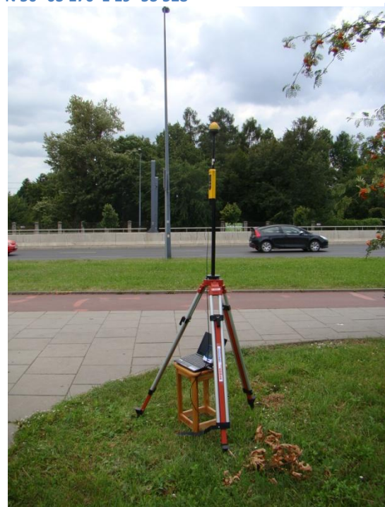
K04 Osiedle Grzegórzki Rondo Mogilskie N50°03'829 E19°57'617