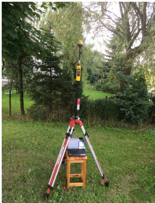
L06 Osiedle Radogoszcz Wschód Al. gen. Sikorskiego – Julii N51° 49'044 E19° 26'265