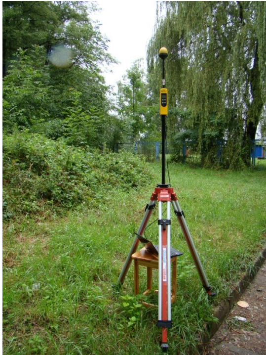
K09 Osiedle Nowy Prokocim Szpital Dziecięcy N50°00'722 E19°59'873