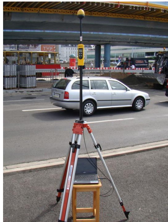
W04 Centrum Śródmieście Aleje Jerozolimskie/Jana Pawła II N52°13'723 E21°00'078