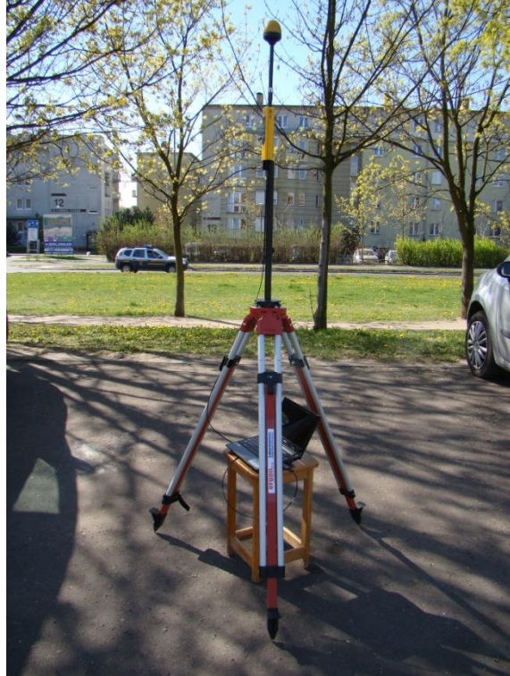
P03 Piątkowo - Osiedle Jana III Sobieskiego ul. Szymanowskiego N52° 27'38.3"E16° 54'43.7"