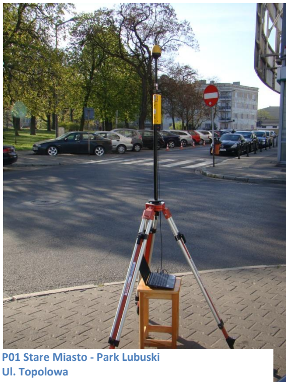
P01 Stare Miasto - Park Lubuski Ul. Topolowa N52° 24'00.0" E16° 55'21.2"