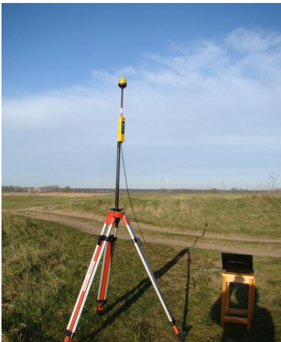
P00 Rogalinek teren nad Wartą N52° 14'45.4" E16° 53'57.7"