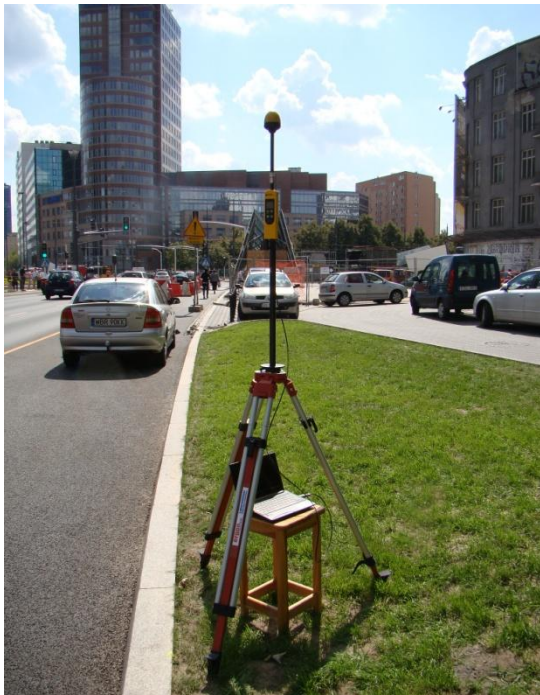
W05 Centrum Śródmieście Świętokrzyska / Jana Pawła II N52° 14'219 E20° 59'511